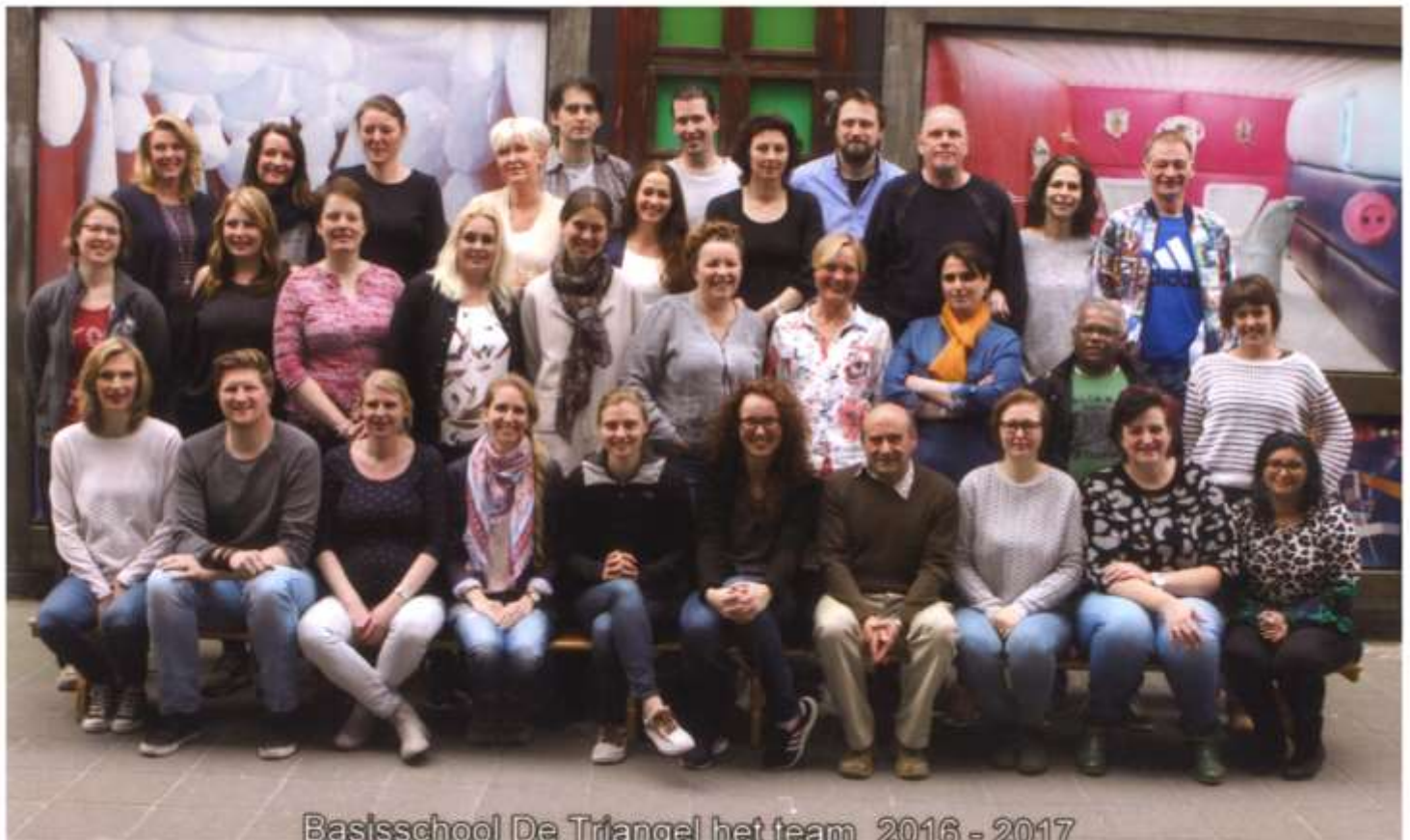
Basisschool De Triangel het team 2016 - 2017